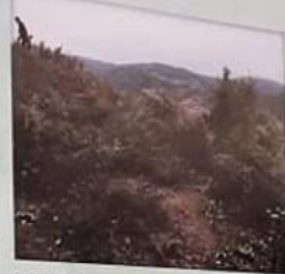
PAS | AFTER